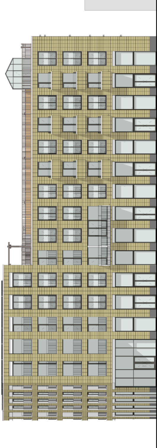
naastgelegen gebouw intocastel